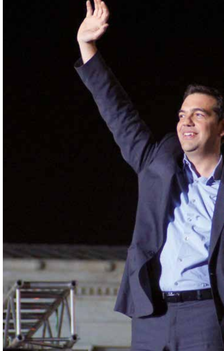
Alexis Tsipras ontvangt de toejuichingen op de avond van de Griekse v