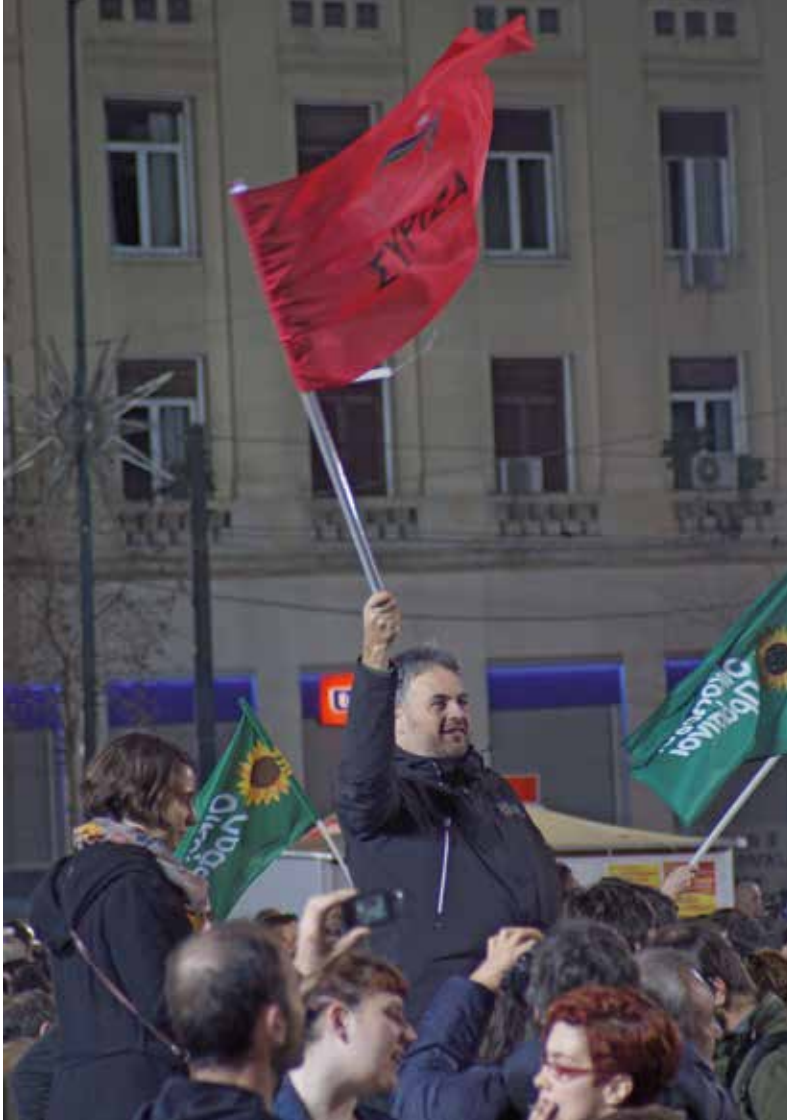
De Syriza-aanhang viert de overwinning.