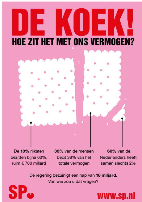
De posters van 2010 en 2015. Pagina rechts: de nieuwe poster.