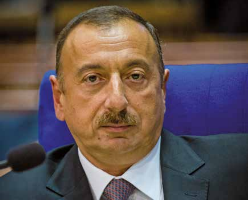
President Ilham Aliyev van Azerbeidzjan bedrijft 'kaviaardiplomatie' om Europese politici voor zich te winnen.

van het straatgeweld in de ziekenhuizen werden opgevangen. Dat was vlak voor de massale arrestatie van artsen en verpleegkundigen en de inval in het hoofdkantoor van Artsen zonder Grenzen in Manama.