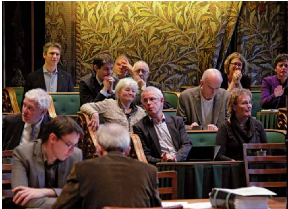
De SP-fractie in de Eerste Kamer met in het midden Tiny Kox.

'De verkiezingen voor de Provinciale Staten en Eerste Kamer staan vast. Die zijn altijd een keer in de vier jaar. Net als de gemeenteraadsverkiezingen. Dat geldt niet voor de verkiezingen voor de Tweede Kamer. Hoewel dit niet in de Grondwet staat, is het gebruik geworden dat als de regering tussentijds valt, de Tweede Kamer ontbonden wordt en er nieuwe verkiezingen worden uitgeschreven. Op dit moment rijst wel de vraag of het kabinet kan blijven regeren zonder steun van de Eerste Kamer.'