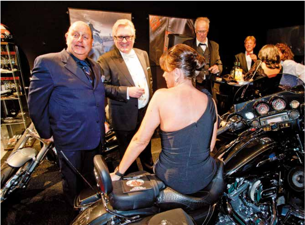
Bezoekers van de Miljonair Fair.