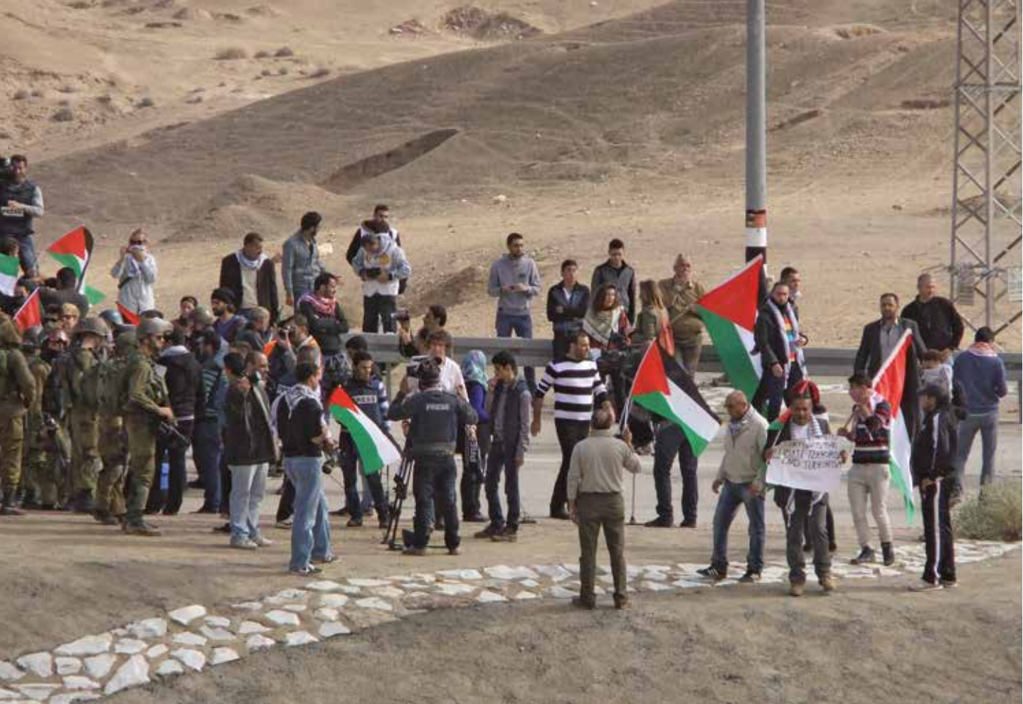
Een van de vele wekelijkse, soms dagelijkse demonstraties tegen de Israëlische bezetting van Palestijns gebied. Hier in de buurt van Jericho. Alleen al voor het kijken naar de demonstratie krijgen mijn Palestijnse begeleiders een boete van 100 euro.

Naties stellen een onderzoek in en Amnesty International wijst ook verwijtend naar de Israëlische regering.