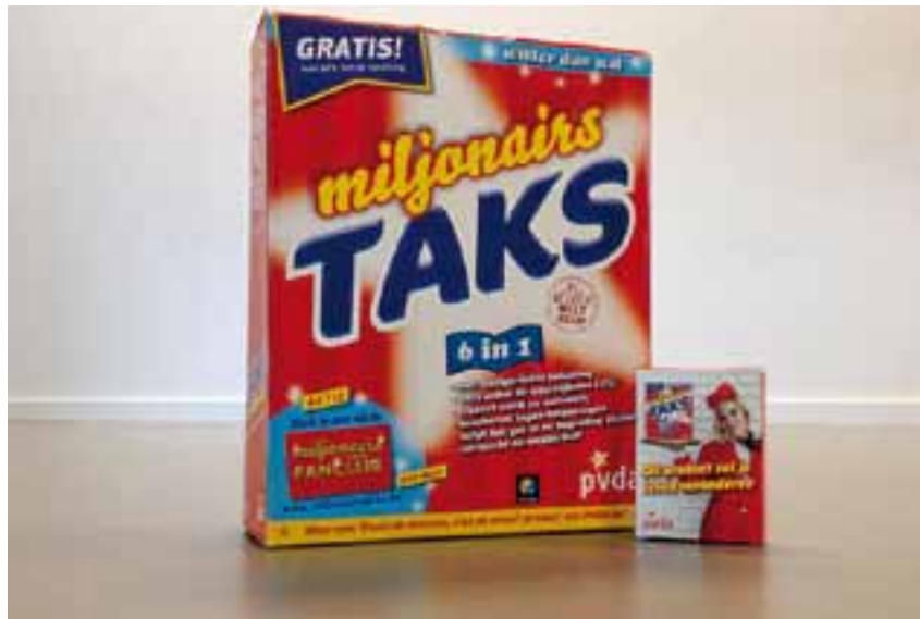
Actiemateriaal bij de miljonairstaks-campagne van de Belgische PVDA.