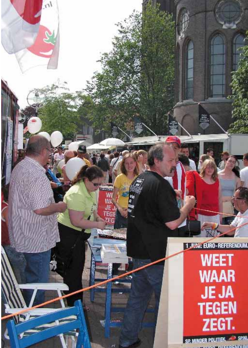
Mei 2005. SP'ers voeren actie tegen de Europese Grondwet.

2006 aangaven dat ook een nieuw Europees verdrag aan de bevolking moest worden voorgelegd, kwam het tweede referendum er nooit. Het CDA onder leiding van oud-premier Balkenende verzette zich ertegen en won het pleit tijdens de formatie. De oppositie, waaronder de SP, ondernam nog een poging om een tweede referendum per wet af te dwingen, maar dat voorstel leidde schipbreuk door toedoen van de toenmalige regeringspartijen, die tegen waren. Daardoor werd het Verdrag van Lissabon nooit aan de bevolking voorgelegd en alleen in het parlement, waar de pro-Europese partijen een meerderheid hadden, behandeld en aangenomen.