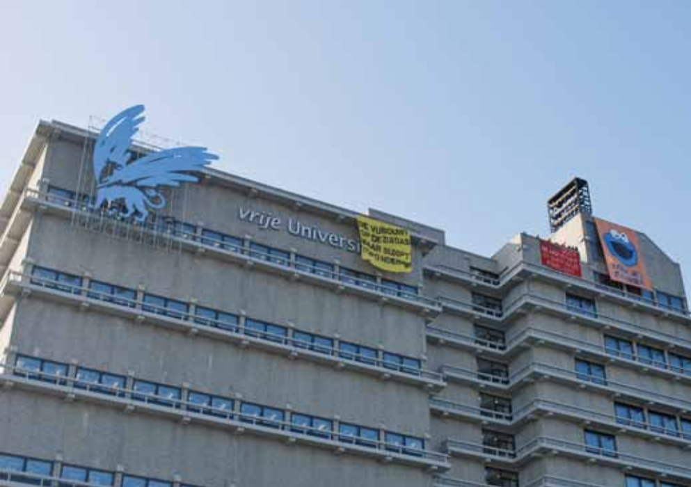
Studenten Aard- en Levenswetenschappen bezetten de bovenste verdieping van de Vrije Universiteit uit protest tegen de enorme bezuinigingen op hun opleidingen.

aan doen? Vrij snel bleek dat er veel animo voor was. Steeds meer mensen kwamen langs. Tegelijkertijd bleek dat de problemen vrij duidelijk waren, maar dat de oplossingen niet voor de hand lagen. Vanaf daar zijn we begonnen met het delen van onze analyse van de problemen aan de VU en andere Nederlandse universiteiten, en een oproep aan de VU-medewerkers en studenten om met ons mee te gaan werken aan oplossingen. Een deel van het directe probleem – en dus de oplossing – lag natuurlijk bij de scheve machtsverhoudingen, het gebrek aan zeggenschap van medewerkers en het gevoerde beleid van het universitaire bestuur.