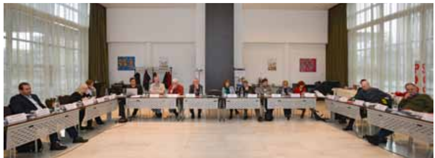
Informele ontmoeting van Europese modern linkse partijen in Amersfoort.

Sinds 2007 komen we als modern links bijna elk jaar bijeen. Dit jaar was