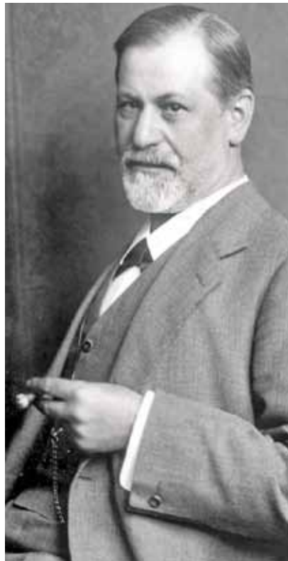
Sigmund Freud, omstreeks 1900

Freud stelt dat ieder mens emotioneel gevangen zit tussen de morele eisen die de samenleving ons oplegt en de ongeremde driften die ons onderbewuste sturen. Ons verstand weet dat we ons moeten gedragen, maar onze onderbuik wil dat niet altijd. Dan raken we in de war en gaan we ons