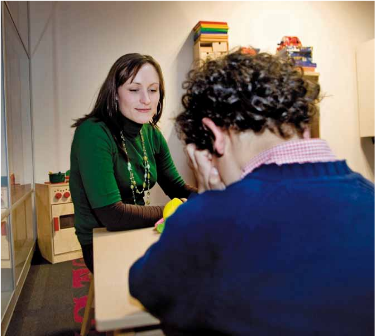
Medewerker van Jeugdzorg met een jongen in een spreekruimte van Bureau Jeugdzorg Rotterdam Zuid.