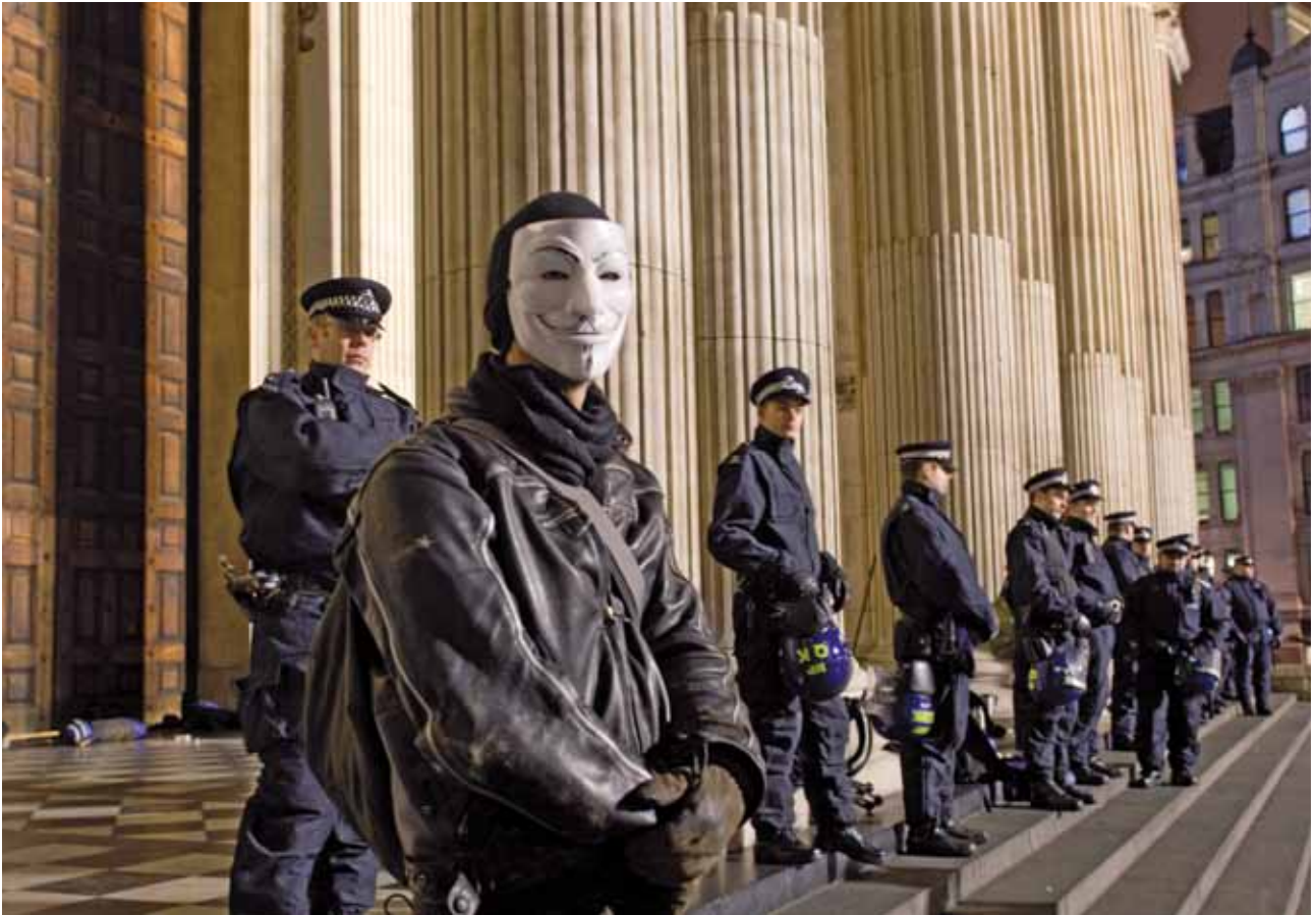
Een demonstrant voor de Londense beurs in 2011.