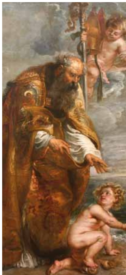
Fragment uit Augustinus door Peter Paul Rubens, ca. 1637.

Augustinus wordt een kerkvader genoemd, om zijn bijdragen aan de christelijke leer. Maar Augustinus was geen theoreticus, eerder een zoeker. Meer nog dan een inkijk in zijn hoofd, geeft hij inzicht in zijn hart. De Belijdenissen zijn een emotionele strijd van een man die inziet waarom hij ongelijk heeft, maar geen stap verder tot de waarheid komt. Totdat