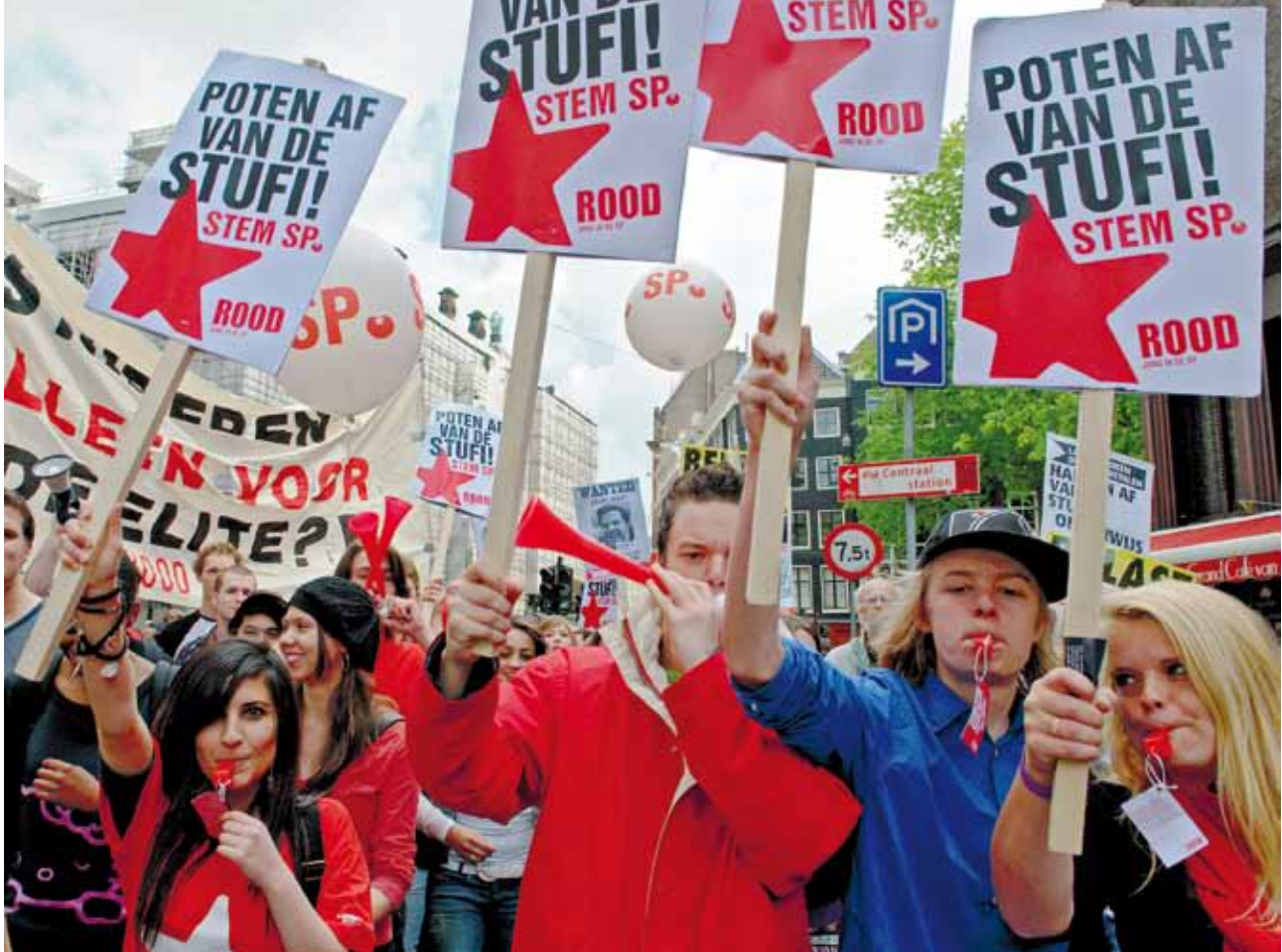
ROOD-jongeren strijden voor het behoud van de studiefinanciering.

omgezet in een gift bij het afronden van (een deel van) de studie. In 2000 is de Wet op de Studiefinanciering herzien, vooral om de rol van de ouders in de wet op te nemen. De grondgedachte van de WSF 2000 was als volgt beschreven: 'Studiefinanciering is een zaak voor drie partijen: de overheid, studerende en hun ouders. Alle drie leveren ze een onmisbare bijdrage. De overheid biedt studenten een basisbeurs en een reisvoorziening. Daarin wordt rekening gehouden met de woonsituatie van de studerende (uit of thuis), de schoolsoort (enerzijds het middelbaar beroepsonderwijs en anderzijds het hoger onderwijs) en eventuele individuele omstandigheden (partner, kinderen). Ouders maken op individuele basis afspraken met hun kinderen over een toelage. Echter, als ouders te weinig inkomen hebben om die kosten te kunnen dragen, springt de overheid bij (aanvullende beurs). Studerende leveren daarnaast een bijdrage in de kosten van hun eigen levensonderhoud door te werken of te lenen. Alles bij elkaar levert dit studerende een naar objectieve normen bezien aanvaardbaar inkomen op.' Inmiddels voldoet het stelsel van