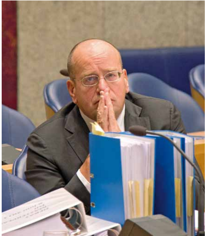
Staatssecretaris Teeven: 'Het regime wordt een tikkie strenger.'

'Er zijn mensen die meerdere keren veroordeeld zijn voor een strafbaar feit. Zij weten hoe het Nederlandse