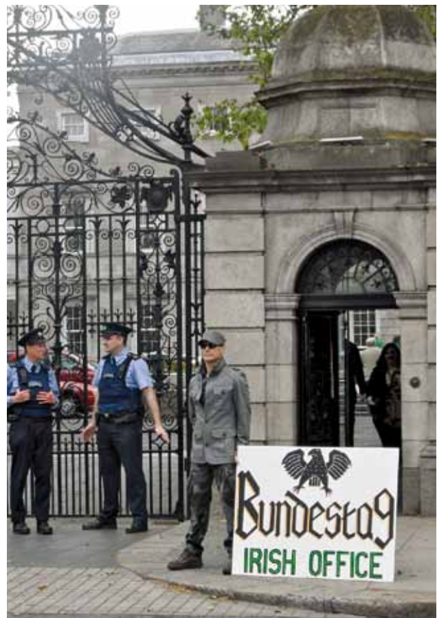
Demonstrant voor de ingang van het Ierse Parlement.

Eindigen we met een compliment voor de Ieren. Ondanks hun imago van stevige drinkers met een voorliefde voor volksmuziek, tatoeages en trainingsbroeken, ging het er opvallend beschaafd aan toe tijdens de ESM-campagne. Van de duizenden affiches met politieke boodschappen die er hingen in Dublin, was er niet een beklad of vernield. En bij het bezoek aan het parlement, het hart van de democratie, geen paspoortcontrole, geen scan, geen gedoe, maar een 'Welkom' en 'Komt u verder'. Ministers en ambtsdragers die zich ontspannen mengen onder het publiek. Kom daar maar eens om in andere Europese hoofdsteden, waar de politieke elite een blokje om loopt om de man of vrouw in de straat te ontlopen.