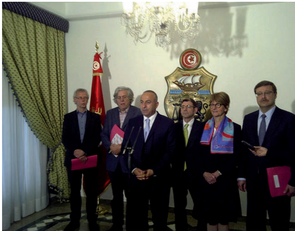
Delegatie Raad van Europa in Tunis: helpen bij eerste vrije verkiezingen

In Syrië heeft president Assad de al 50 jaar geldende noodtoestand officieel opgeheven. Maar zijn politie- en legertroepen blijven uiterst gewelddadig