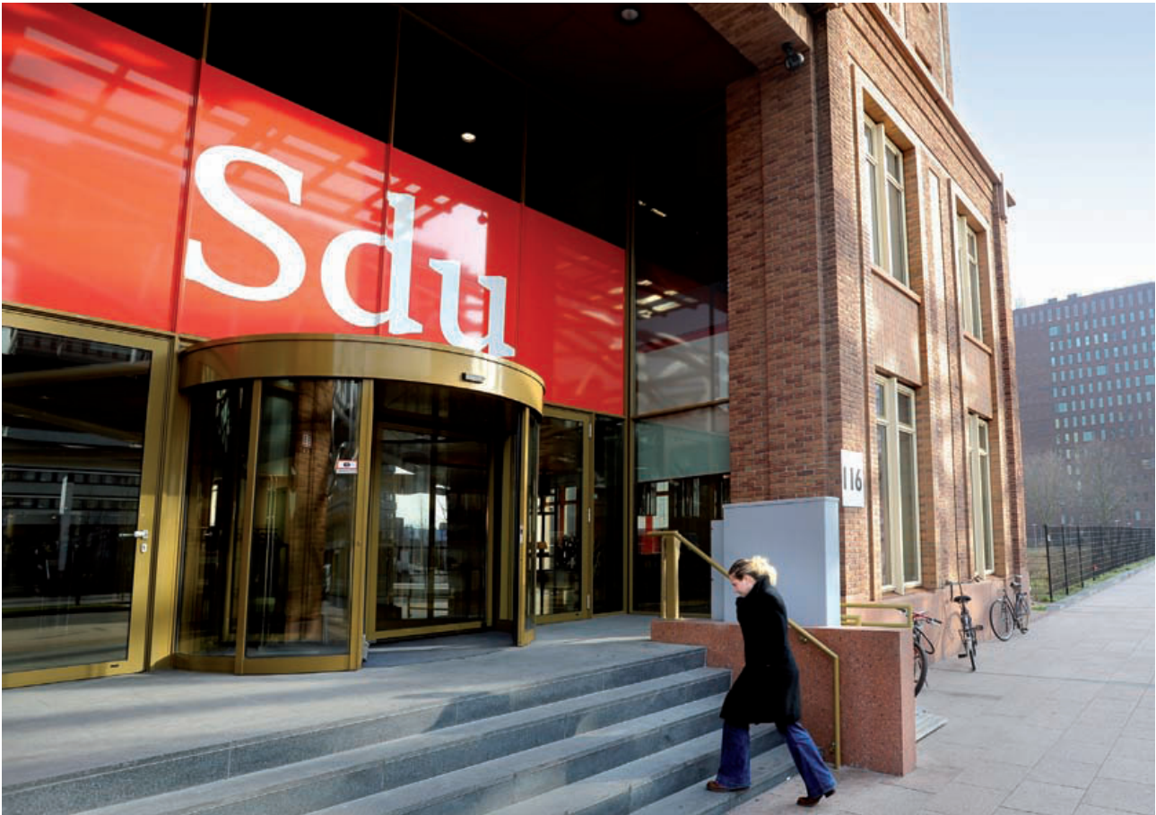
Sdu, de voormalige staatsdrukkerij en uitgeverij.

Verzelfstandiging is een minder vergaand proces, waarbij een overheidsbedrijf wordt omgevormd in een zelfstandig publiekrechtelijk of privaatrechtelijk bedrijf, maar waarbij de overheid de meerderheid van de aandelen in handen houdt. Verzelfstandiging kan een eerste stap zijn op weg naar privatisering.