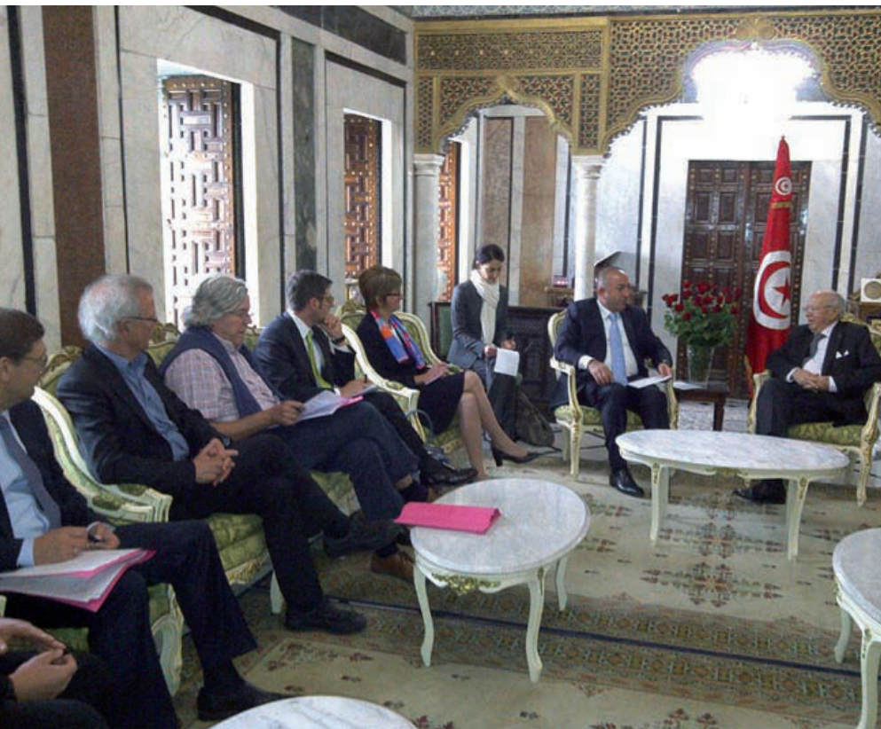
Interim-president Mebazaa tegen delegatie Raad van Europa: 'Bang voor Iraakse toestanden in Libië'

kiezen. Die moet het land een nieuwe Grondwet geven. Een grote klus, waarvoor nog veel te doen valt, zo bleek tijdens een werkbezoek van een delegatie van de Raad van Europa, waarin ik namens de fractie van Verenigd Europees Links deelnam. We spraken af dat de Raad van Europa een team van waarnemers naar de verkiezingen stuurt. We kijken ook of we kunnen helpen bij de begeleiding van binnenlandse waarnemers. Dat kunnen we wellicht samen met het Europees Parlement doen. En we stellen onze vele ervaringen en expertise over verkiezingen en veranderingsprocessen beschikbaar. Centraal en Oost-Europa maakten twintig jaar geleden een vergelijkbare verandering door van een autoritair naar een democratisch stelsel. Van die positieve en negatieve ervaringen valt veel te leren voor de Tunesiërs. Tijdens het werkbezoek vonden besprekingen plaats met interim-president Mebazaa, premier Essebsi en minister van Buitenlandse Zaken Mouldi Kefi. Ook werd overlegd met de nationale commissie die het