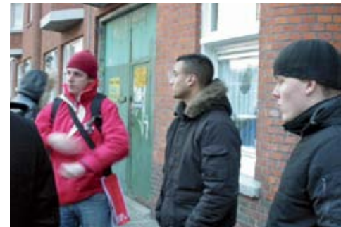
SP'ers aan het Buurten in de Schilderswijk