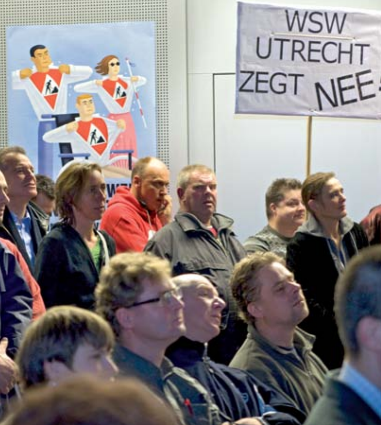
Manifestatie Armoede Werkt Niet in Den Bosch.

TNT bereikten na enkele stakingsdagen dat het aantal gedwongen ontslagen toch werd teruggebracht. Iets dat volgens de directie echt niet meer kon, zoals ze de bevolking in een aantal paginagrote advertenties bij herhaling liet weten. TNT zal heel wat postzegels hebben moeten verkopen voor die propagandacampagne. Ook de stakers in de distributiecentra van de Nederlandse grootgrutter uit Zaandam lieten aan het eind van het jaar zien dat het mogelijk is om zelfs een multinational als Albert Heijn te dwingen tot het betalen van meer loon. Door zeer strategisch te dreigen met stakingen vlak voor de kerst kregen ze de directie op de knieën.