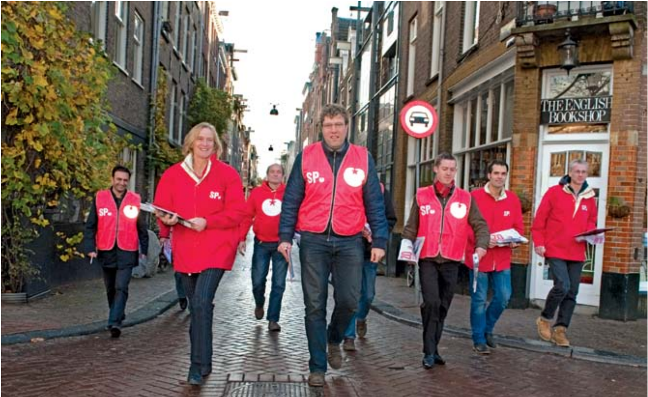
SP-Amsterdam op pad in hun stad.

geval een begin van de oplossing van het probleem aan.