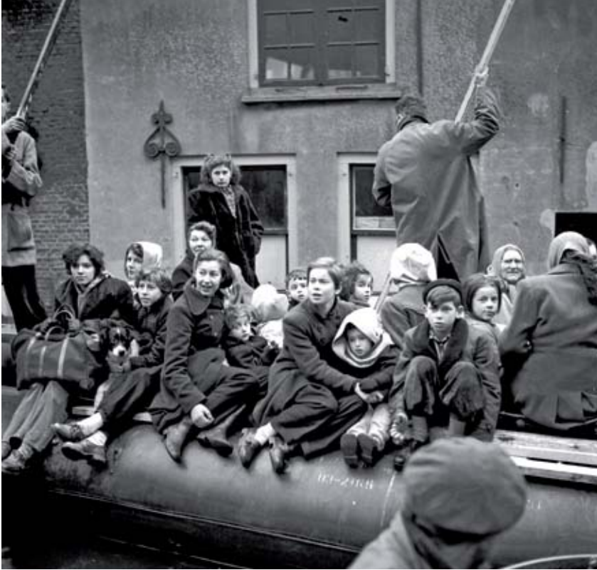
De watersnood van 1953 werd pas veertig jaar later geschreven worden dankzij de verhalen van meer dan tweehonderd ooggetuigen van de ramp.