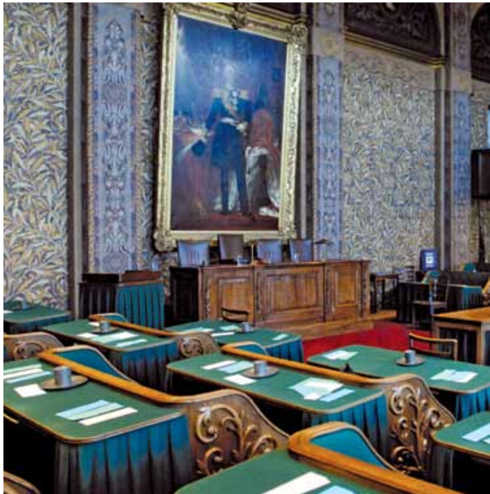
De vergaderzaal van de Eerste Kamer

De Provinciale Staten zijn onbekend. Het werk dat door de 564 Statenleden en de dagelijkse bestuurders – de ‘gedeputeerden’ – in de provincies wordt verzet, onttrekt zich vaak aan het oog. Toch gaat er heel wat geld om bij de twaalf provincies. Afgelopen jaar was er in totaal bijna 7,5 miljard euro aan uitgaven begroot. Het grootste deel daarvan is besteed aan verkeer en vervoer (28 procent) en aan welzijn (23 procent). Activiteiten op het gebied van economie en van milieu zijn andere grotere uitgavenposten. In het verleden is veel wildgroei opgetreden en zijn provincies zich met van alles en nog wat gaan bemoeien. Dat konden ze zich permitteren door hun in vergelijking met andere overheden riante reserves. Die zijn door de verkoop van de energiebedrijven Essent en Nuon nog veel groter geworden. De provincies hebben nu samen 17 miljard achter de hand. Volgens de meeste politieke partijen dienen provincies zich echter veel meer te richten op een aantal kerntaken en de rest vooral over te laten aan de gemeenten. De provincies zullen het hoe dan ook met beduidend minder geld moeten gaan doen in de nabije toekomst. Dat alleen wordt een uitdaging voor de nieuwe Provinciale Staten.