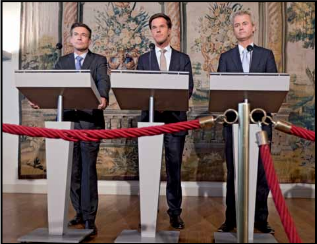
Martijn Beekman / Hollandse Hoogte