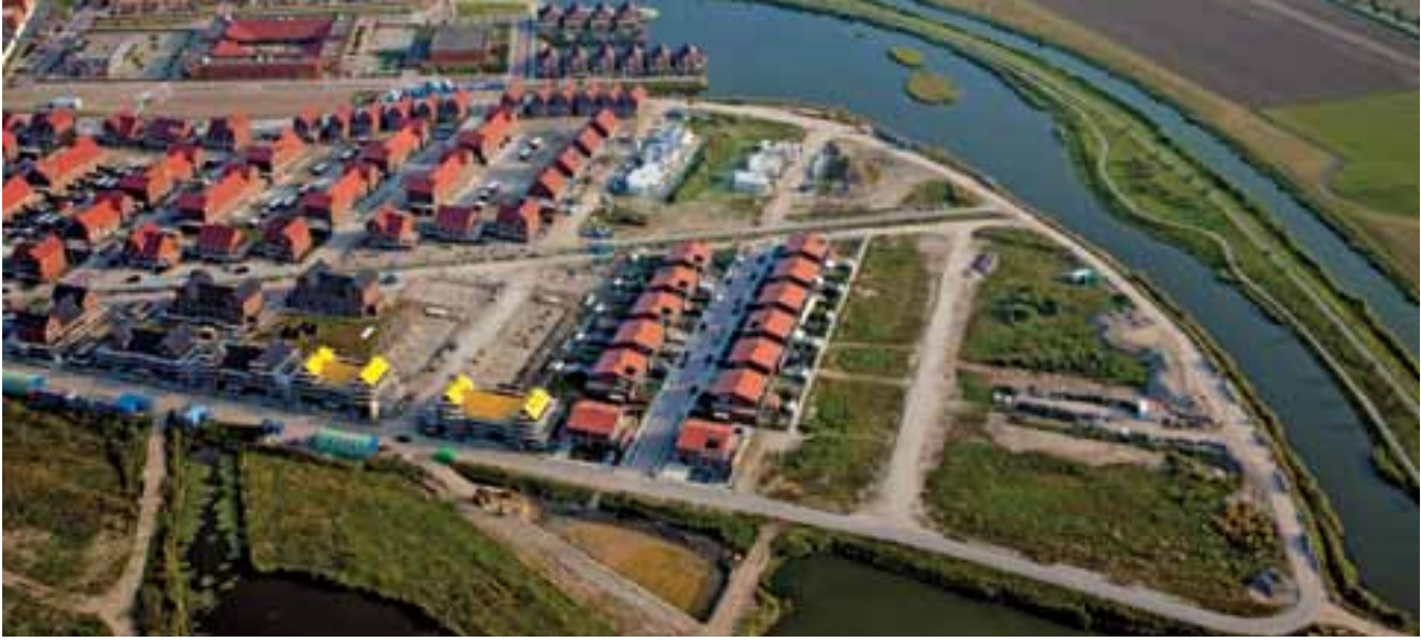
Barendrecht, De wijk Carnisselande. Waaronder misschien CO 2 opgeslagen gaat worden

Waarschijnlijk is die periode in werkelijkheid nog korter, omdat een deel van de ondergrondse opslagcapaciteit geclaimd zal worden voor toekomstige gasopslag-projecten. En dan zou Nederland ook nog eens de CCS-draaischijf van NW-Europa moeten worden?