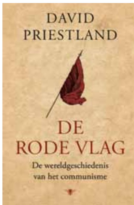
David Priestland, De rode vlag. De wereldgeschiedenis van het communisme (De Bezige Bij, 2009)

'De rode vlag' is een inspirerend boek, omdat het de vele pogingen beschrijft van veel soorten communisten om mensen te bevrijden en te emanciperen. Het boek laat ook veel redenen zien waarom die strijd verzandde. De belangrijkste reden lijkt dat communisten zich opstelden als revolutionaire voorhoede, die politiek bedreef uit naam van de bevolking. Of men nu een guerrillastrijd voerde, de planeconomie organiseerde of een 'sprong voorwaarts' afdwong, de voorhoede werd een nieuwe elite, die het contact met de volgers verloor. Vooral in landen zonder democratische traditie kon dit leiden tot isolering en werd de partij een middel tot behoud en onderdrukking, het meest uitgesproken in Noord-Korea. In andere landen liepen communisten juist voorop in de strijd voor democratisering, zoals in India, waar zij in de deelstaat Kerala en West-Bengalen al ruim dertig jaar besturen en kiezers voor zich weten te winnen.