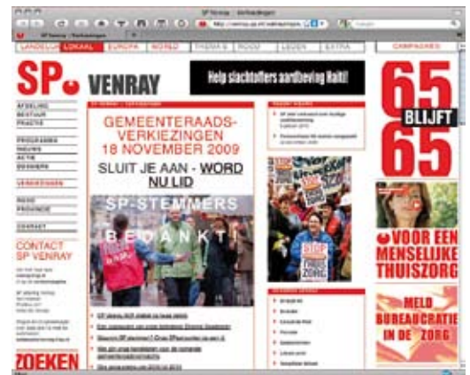
Venray heeft haar campagne website gearhiveerd op: venray.sp.nl/verkiezingen