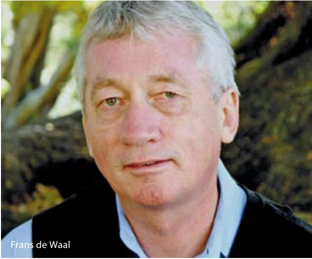
Frans de Waal