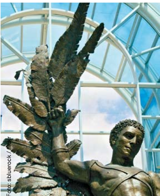
Een beeld van Prometheus

In de Griekse mythologie werd de aarde oorspronkelijk bevolkt door reuzen ('titanen'), die werden verdreven door de goden ('de titanenstrijd'), onder leiding van oppergod Zeus. Prometheus ('de vooruitdenkende') was de zoon van een titaan, die van Zeus de opdracht kreeg uit leem de mensen te maken, naar het evenbeeld van de goden. Deze mensen waren echter dom. Daarom stal Prometheus het vuur – symbool van de rede – van de goden en gaf het aan de mensen. Zij leerden metaal te bewerken en technologie te ontwikkelen. Dit was het begin van de beschaving. De straf van Zeus was echter verschrikkelijk. Hij stuurde de mensen de doos van Pandora, waaruit ziekten en rampen zich over de wereld verspreidden. Prometheus werd vastgeketend aan een berg, waar een arend elke dag zijn lever kwam uitpikken. Dat was de pijn van Prometheus, die vele eeuwen bleef voortduren.