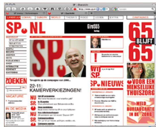
Op www.sp.nl/2006 vind je de SP-campagnesite van de Tweede Kamerverkiezingen in 2006