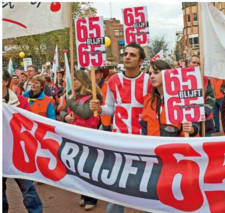
De AOW-discussie staat niet op de gemeentelijke politieke agenda, maar je moet hem toch voeren

Dat wij van plan waren om ook buitenparlementair actief te blijven, heeft in de coalitiebesprekingen trouwens geen