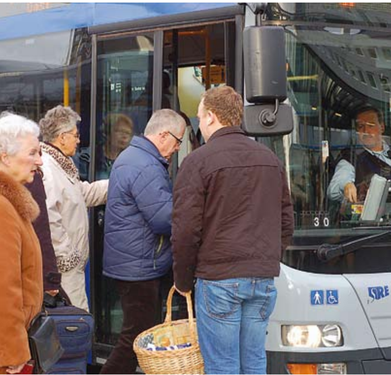
Duploblokjes: SP-ouderen in actie voor gratis openbaar vervoer

kwestie verklaard. Toen het Program geschreven werd, zag het er naar uit dat er in de komende vier jaar niet veel zou gebeuren. Naderhand pakte dat heel anders uit. De SP is organisatorisch de drijvende kracht in een samenwerkingsverband met milieugroepen en omwonenden om de groei van het vliegveld binnen de perken te houden. De verantwoordelijke wethouder is van de PvdA en binnen die partij is de uitbreiding sterk omstreden.