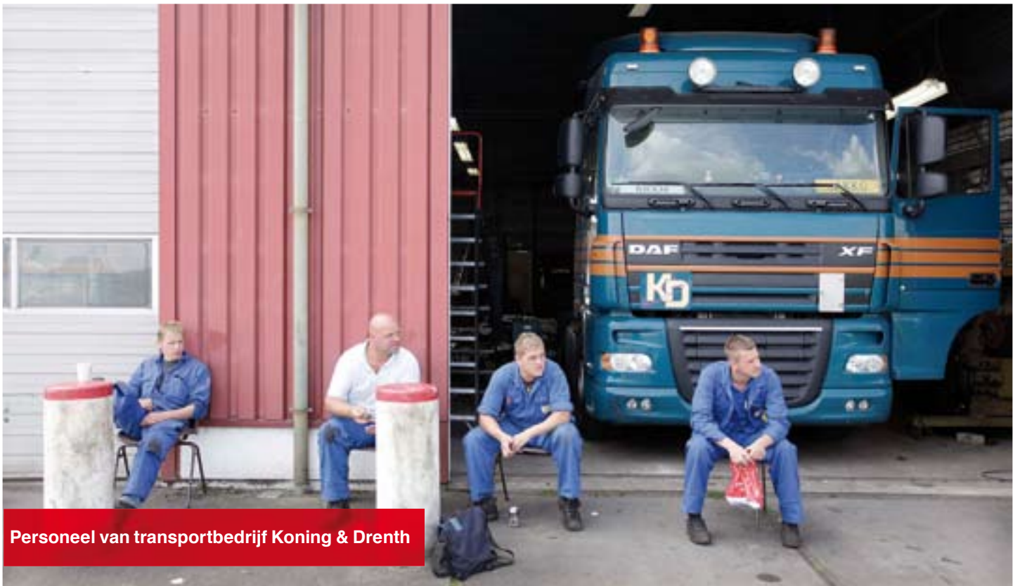
Personeel van transportbedrijf Koning & Drenth