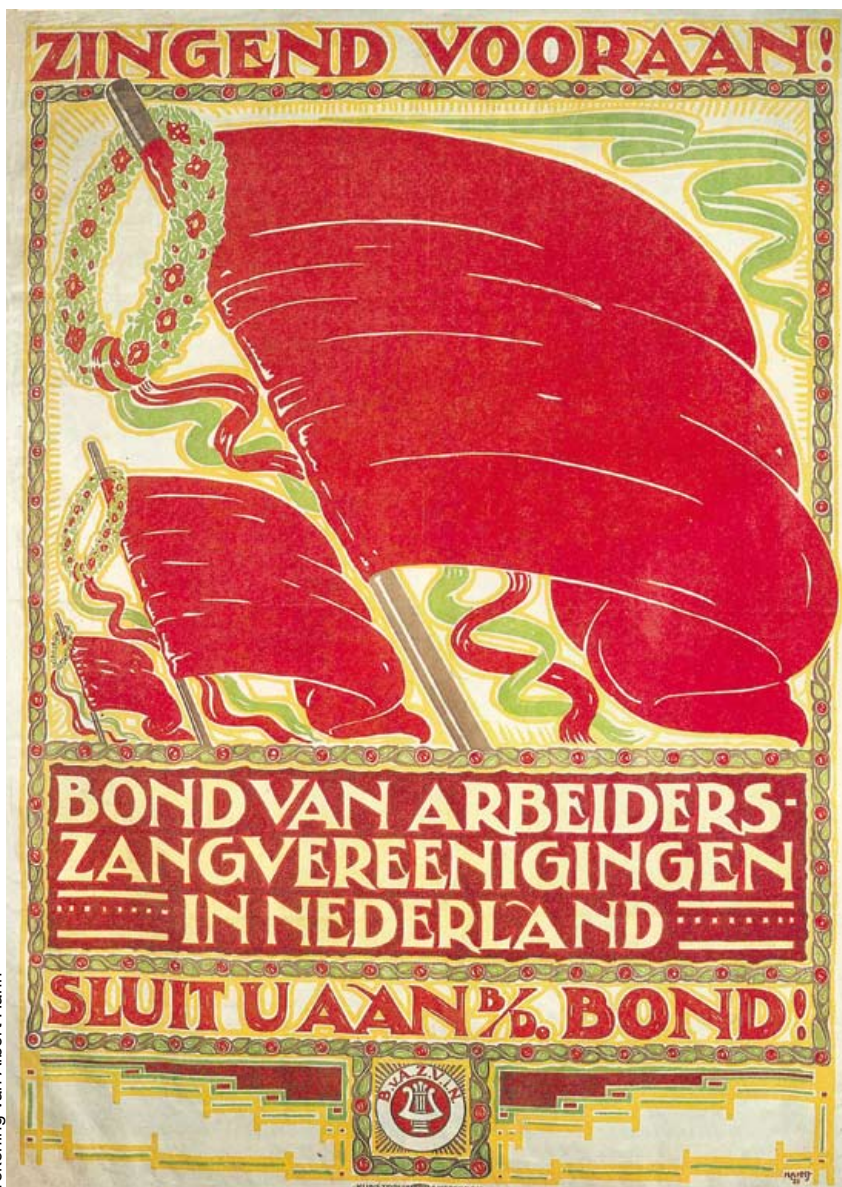
Een van de pijlers van de emancipatie van de arbeider.

Als we het gezwollen negentiende eeuwse taalgebruik voor lief nemen, dan kunnen we deze eerste regels van het partijprogramma van de Eerste Internationale beschouwen als de nog steeds geldende basis van het socialisme. Er staat kernachtig in dat socialisten een einde willen aan alle privileges. Socialisten strijden echter ook voor geestelijke verheffing en tegen politieke ongelijkheid. Die strijd verbindt alle arbeiders over de hele wereld. Dat hebben socialisten altijd onder emancipatie verstaan.