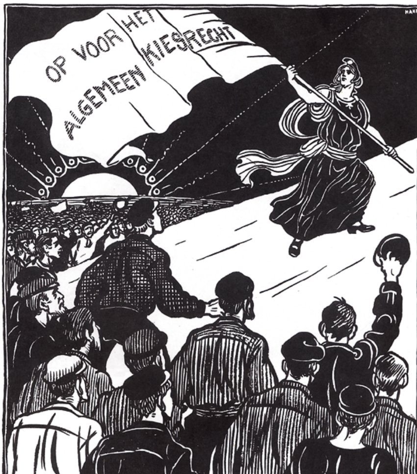
Tekening van Albert Hahn

Om de uitbreiding van het kiesrecht te bereiken is tientallen jaren strijd gevoerd, waarbij socialisten jaarlijks massale demonstraties organiseerden. Een aantal keren is het kiesrecht gedeeltelijk uitgebreid, maar pas in 1919 kregen alle volwassenen stemrecht. Daarmee was een belangrijk privilege van de rijken geslecht. Het recht om via gekozen afgevaardigden mee te praten over de inrichting van de staat was niet meer afhankelijk van iemands sekse of portemonnee. De arbeiders waren politiek geëmancipeerd. De resultaten van die uitbreiding vielen echter tegen. Diep in hun hart hadden de socialisten natuurlijk gehoopt dat de arbeidersklasse, de ruime meerderheid van de bevolking, na de uitbreiding van het kiesrecht socialistisch zou stemmen.