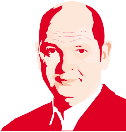
JAN MARIJNISSEN Voorzitter SP

Zoals het woord kapitalisme al aangeeft, is de factor kapitaal bovengeschikt aan de factor arbeid. Dit betekent dat bij alle strategische afwegingen in de economie het winst-oogmerk van de kapitaalverschaffer centraal staat. Omdat dat onvermijdelijk leidt tot excessen, hebben we regels opgesteld. Zo wordt de door de werkgevers en werknemers overeengekomen CAO door de overheid algemeen verbindend verklaard voor de hele sector. Daarmee wordt oneerlijke concurrentie tegengegaan en ontstaat er een gelijk speelveld, terwijl de rechten en het loon van de werknemer zijn veiliggesteld. Er zijn ook milieuregels waar de bedrijven zich aan moeten houden en hun producten moeten aan bepaalde eisen voldoen. De democratisch gelegitimeerde overheid stelt de marges vast waarbinnen de private economie zijn gang mag gaan.