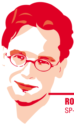
RONALD VAN RAAK SP-Tweedekamerlid

In 1813 werd Nederland een monarchie en in 1815 een koninkrijk, nadat de Noordelijke Nederlanden eeuwenlang een republiek waren geweest. In 1919 werd Nederland een democratie, doordat het algemeen kiesrecht werd ingevoerd. In 2009 bijten beide staatsvormen elkaar nog steeds. In de nabije toekomst zal een nieuwe koning aantreden. Dit is een mooie gelegenheid om de monarchie te moderniseren en aan te passen aan de eisen van de democratie. Door de koning te ontslaan van zijn politieke taken en Willem-Alexander en Maxima een ceremoniële functie te geven.