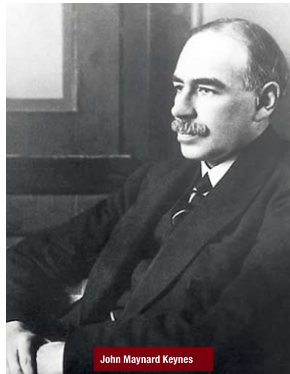
John Maynard Keynes

Keynes bleef nog lang na zijn dood zeer populair. Zelfs de Republikeinse president Nixon verklaarde zich in 1971 keynesiaan. De uitspraak "We're all keynesians now" die vaak aan hem wordt toegedicht, komt overigens eigenlijk uit de mond van de grootste tegenhanger van Keynes, Milton Friedman. Volgens Friedman zelf is zijn uitspraak later uit zijn context