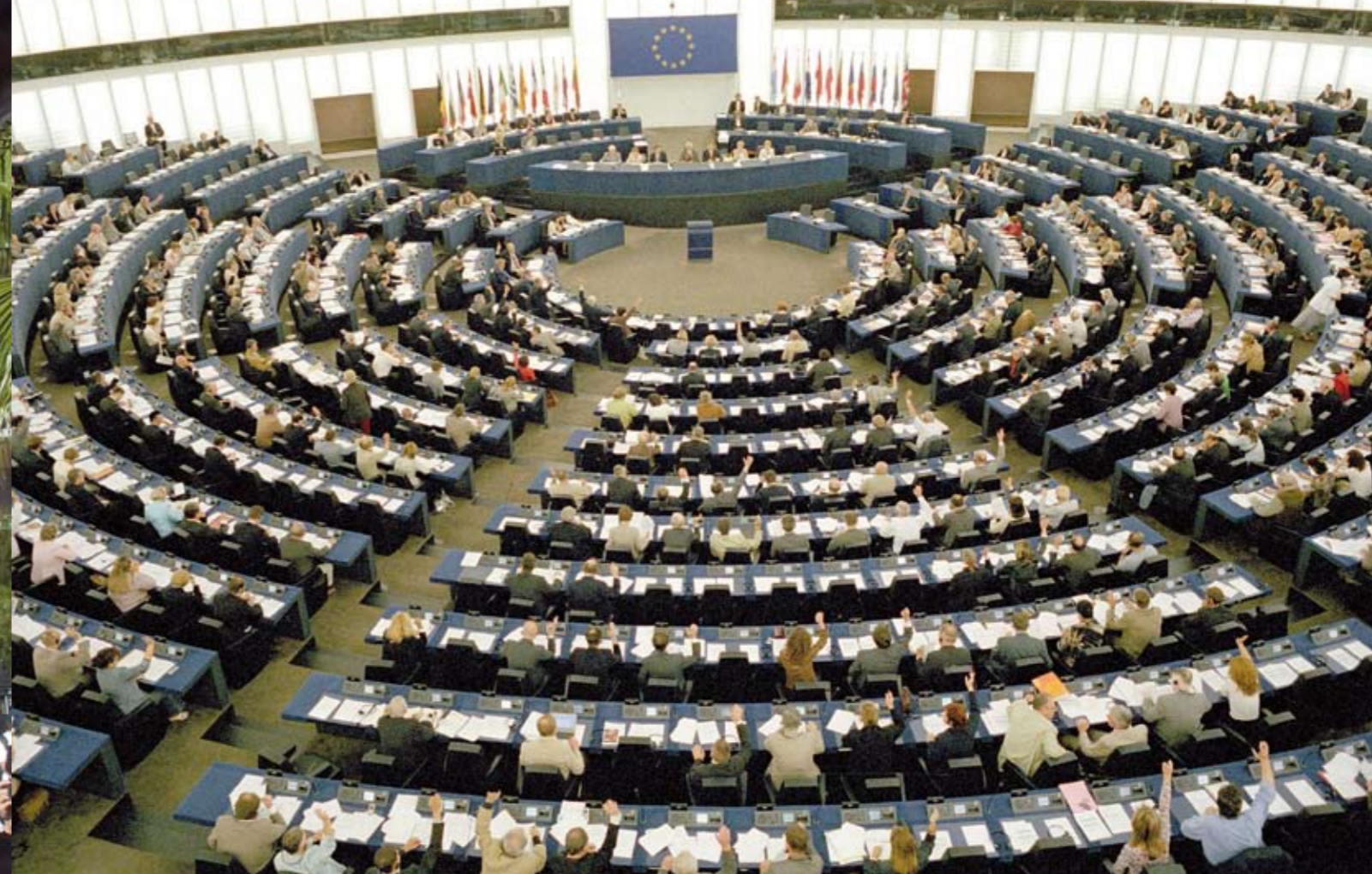
Straatsburg: stemmingen in het Europelement

Uiteindelijk duren de stakingen nog iets langer dan de door Vavi voorspelde dertien extra dagen. Maar op 29 juni komt er dan toch een doorbraak. Vakbonden tekenen voor een (jaarlijkse) salarisverhoging van 7,5 procent. Bovendien verdubbelt de huursubsidie en worden alle ontslagen stakers weer in dienst genomen. Want, zoals de slogan van Cosatu luidt: 'an injury to one is an injury to all'. Oftewel: één voor allen, allen voor één. Niet alle winst is in percentages uit te drukken, vindt Vavi die de saamhorigheid onder de bonden ziet als "een overwinning voor de arbeidersklasse in het algemeen". Overheid en Cosatu schuiven daags na de doorbraak door van de onderhandelingstafel naar de klapstoeltjes van het ANC-partijcongres in Johannesburg. Daar zal besloten worden welke koers de regeringspartij gaat varen. De verwachtingen zijn dat die flink naar links wordt bijgesteld. ●