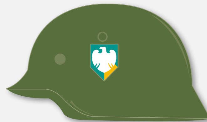
Barclay logo: verkeerde associaties?