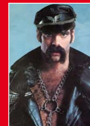
Village People: foute muziek?

Feit is, dat Foute CD – Volume 3 van Q-Music een prima indruk geeft van wat miljoenen mensen ooit naar de muziekwinkel deed rennen. Dat maakt deze dubbel-cd een muzikaal tijdsdocument bij uitstek. Reden genoeg om 'm in huis te halen!