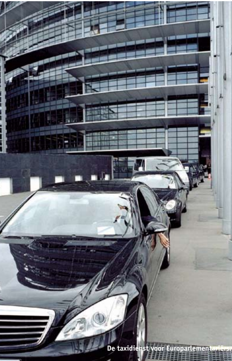
De taxidienst voor Europarlementariërs en de chauffeurs