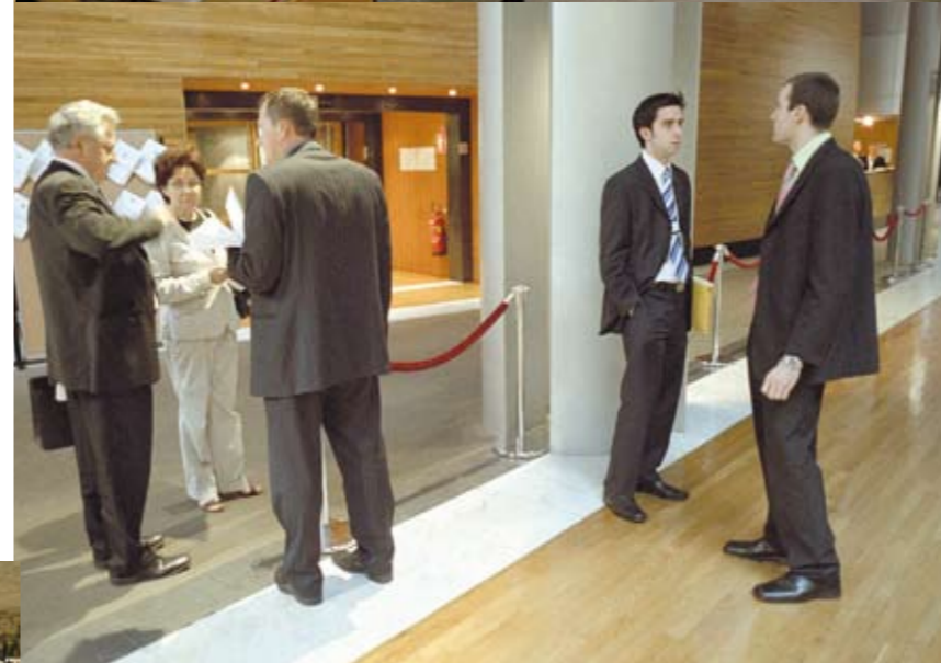
Europarlementariërs: overleg voor de stemmingen