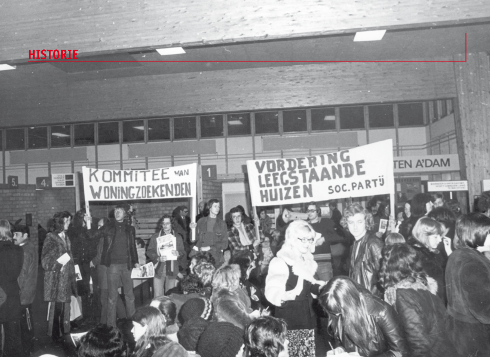
1978: Actie tegen de leegstand in de Transvaal-buurt