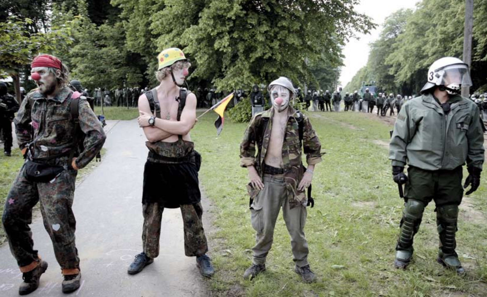
Even zij aan zij: 'The Rebel Clown Army' en een 'Edwin'