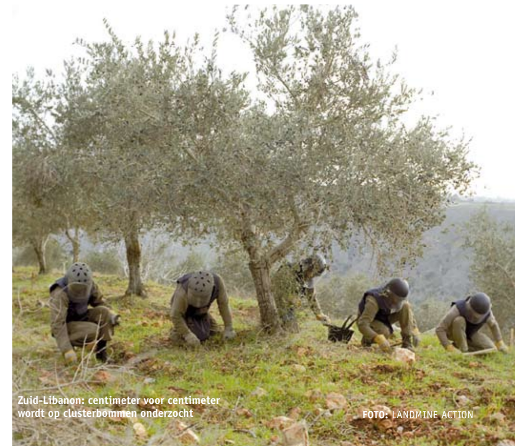
Zuid-Libanon: centimeter voor centimeter wordt op clusterbommen onderzocht

Ook SP-Kamerlid Van Velzen vindt dat een moratorium niet ver genoeg gaat. "We moeten geen halve maatregelen nemen. Clusterbommen veroorzaken onacceptabel leed onder burgers. Ze moeten met onmiddellijke ingang verboden worden." ●