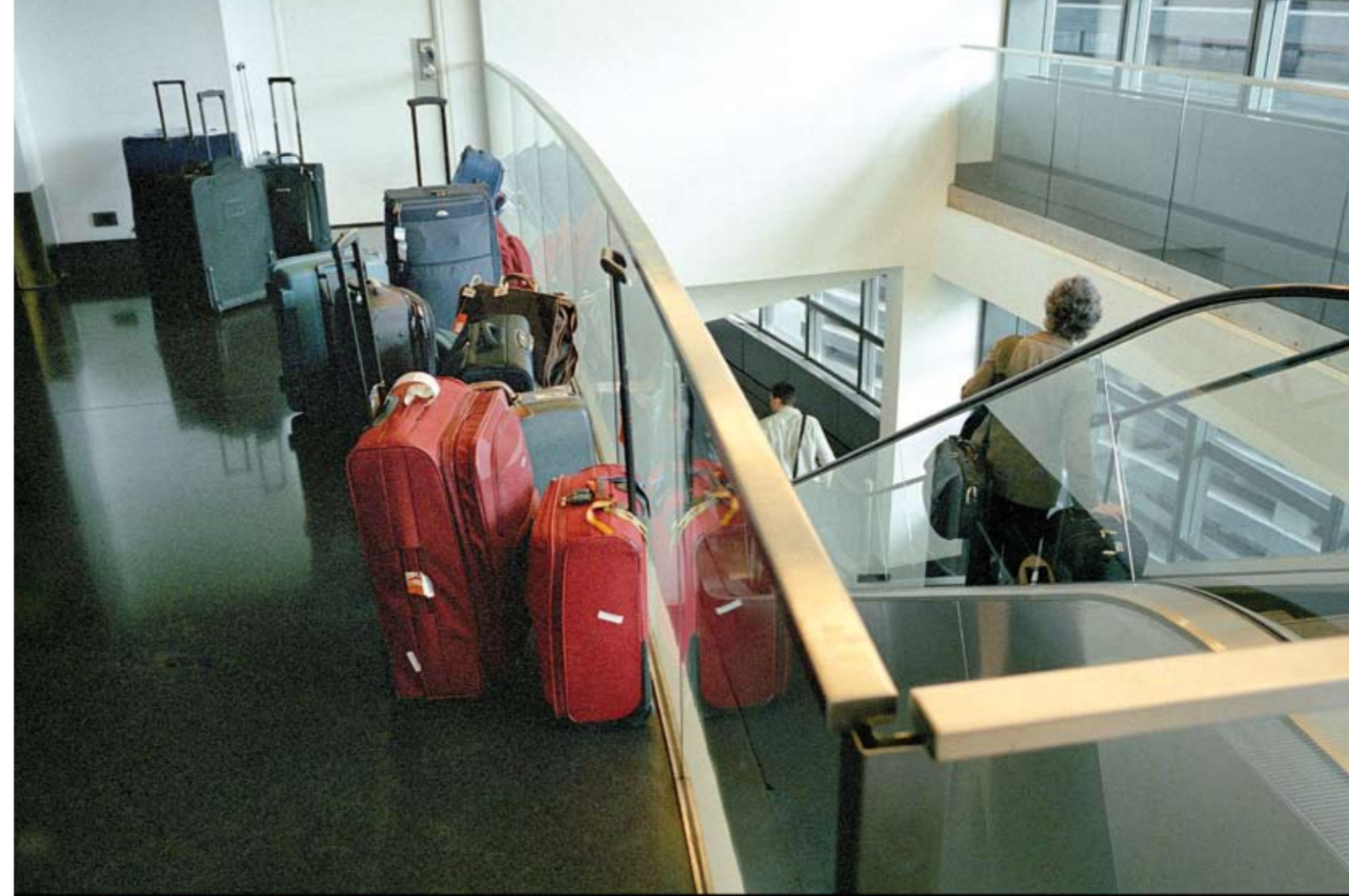
Persoonlijke bagage staat klaar voor de grote reis

Maar de EU heeft wel de sterke neiging om alles naar zich toe te trekken.”