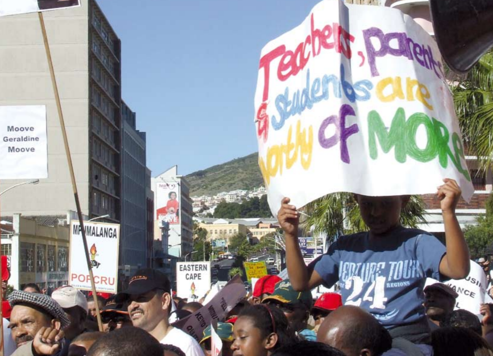
"De grootste staking in onze democratische geschiedenis"

den op het plein. Ntola: "Inderdaad, de vrijheid die we sinds 1994 kennen is niet de vrijheid van de arbeider, maar van de partijbonzen."