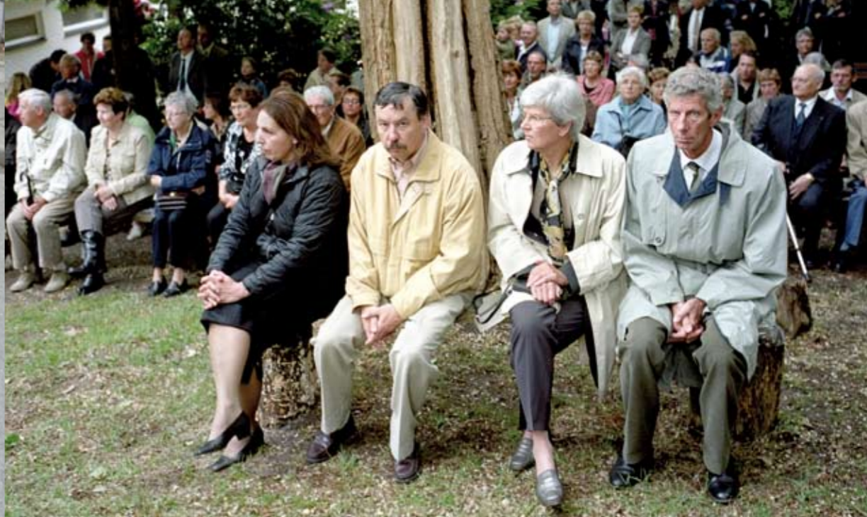
Meimaand processiemaand

Moeders fatsoeneren de jurkjes van de meisjes met bloemenmandjes. Leden van de parochieraad torsen het baldakijn, met daaronder de pastoor met het Heilig Sacrament. Begeleid door melancholische fanfareklanken zet de stoet zich in beweging. In het Limburgse Nunhem wordt de traditionele meiprocesie gehouden, ter ere van beschermheilige Sint Servatius. Bij de Magnificatkapel wordt halt gehouden, op de Servaasberg vindt de Heilige Mis plaats en gaat men ter communie. Nog een kapel, en weer richting kerk. De plechtigheid eindigt met feestelijke muziek. Kermis en café volgen.