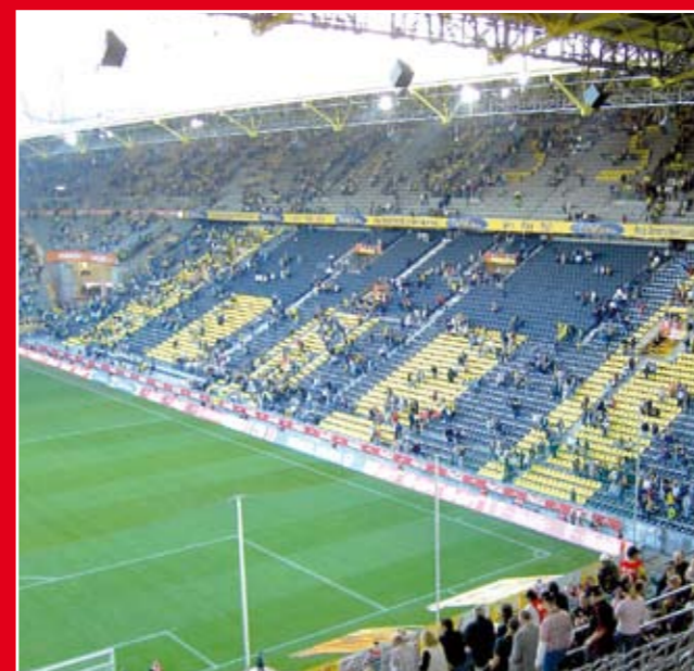
Het stadion van Borussia Mönchengladbach, binnenkort ook wedstrijden van VVV Venlo...?

Profvoetbalclubs zijn nogal eens optimistisch als het om hun verwachte (internationale) doorbraak gaat. Als bijvoorbeeld Europees voetbal wordt gehaald, is men snel geneigd 'groot' te gaan denken en daarbij hoort natuurlijk een nieuw en groter stadion. Maar niet zelden worden de dromen ruw verstoord door de werkelijkheid. Wat te denken van ADO Den Haag, dat een gloednieuw stadion kreeg en prompt degradeerde uit de eredivisie? Of Vitesse (Arnhem), dat zijn ambities met het hypermoderne Gelredome onderstreepte, maar nog steeds wacht op de echte doorbraak? Ook VVV Venlo, zojuist gepromoveerd naar de eredivisie, wil een nieuw stadion. Het Venlose stadion De Koel heeft namelijk een capaciteit van slechts 6.000 zitplaatsen. Maar voorlopig overweegt deze club voor grote wedstrijden, tegen bijvoorbeeld PSV of Ajax, uit te wijken naar de grote stadions van Borussia Mönchengladbach of MSV Duisburg, niet ver over de Duitse grens. Een creatief en realistisch idee, want wie garandeert dat de club komend seizoen niet meteen weer degradeert? En dat de belastingbetalende Venlonaar dan niet moet bijspringen om de miljoenen voor een veel te duur stadion op te hoesten, zoals dat in Den Haag en Arnhem gebeurde? Overigens: het genoemde Borussia Mönchengladbach degradeerde onlangs uit de Bundesliga. Het Borussia-parkstadion, plaats biedend aan 53.000 toeschouwers en één van de mooiste arena's van Duitsland, werd amper drie jaar geleden opgeleverd.