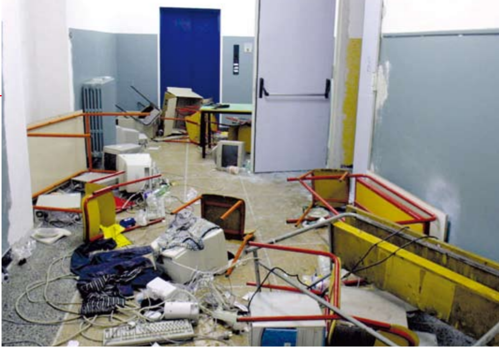
Het mediacentrum in de Pascoli-school nadat de carabinieri heeft huisgehouden

Scholten's radioverslag concentreert zich op de slachtoffers in de scholen. Genua had in een buitenwijk twee scholen beschikbaar gesteld voor demonstranten en pers, ver buiten de 'rode zone' waar de G8-top werd gehouden. In de ene school zouden ze kunnen overnachten, in de tweede school werd het mediacentrum geïnstalleerd. Vlak voor middernacht, nota bene na het einde van de G8-top, viel een politiemacht van 200 personen de Diaz-school binnen en knuppelde