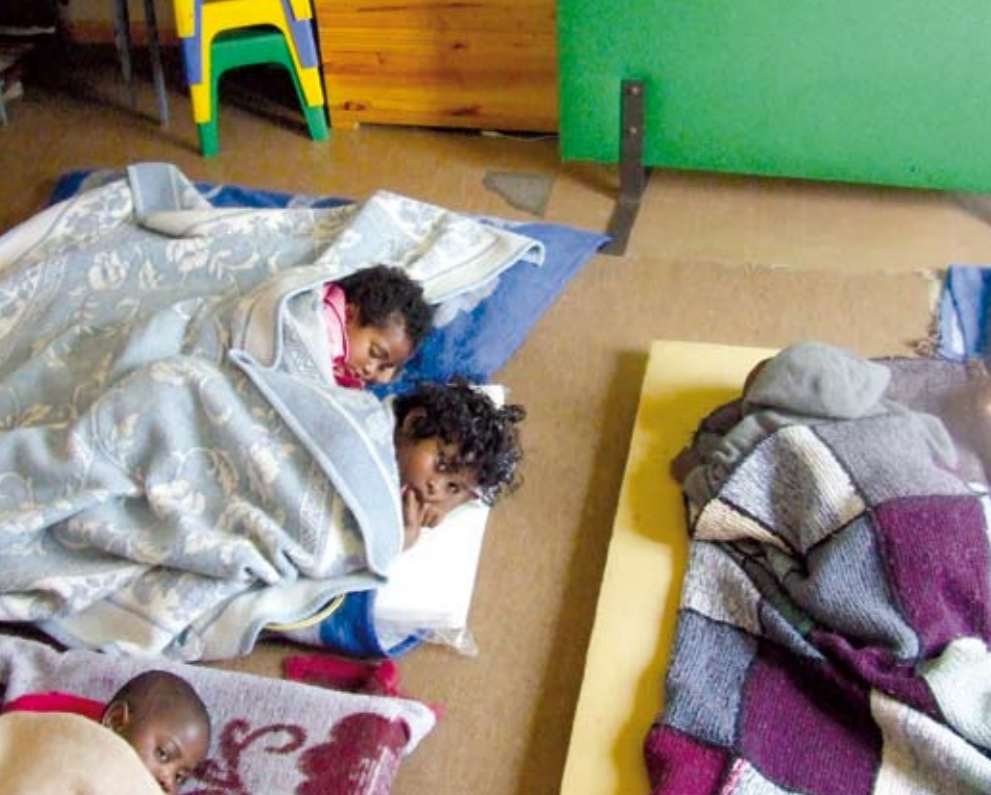
Vluchtelingenkamp Bon Espérance in Kaap de Goede Hoop. Eind april werden de kinderen gemolesteerd door Zuid-Afrikaanse leeftijdsgenootjes