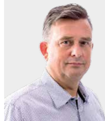
Emile Roemer fractievoorzitter SP

Als ik zie hoeveel ouderen mantelzorg geven, of op hun kleinkinderen passen als de ouders werken. Geen sportvereniging kan draaien zonder vrijwilligers en ook dat zijn vaak ouderen. De VVD ziet de AOW als een kostenpost, voor mij is het een goede investering. In een fatsoenlijke oude dag, maar ook in ons land.