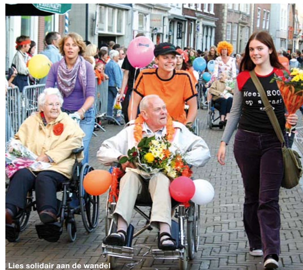
Lies solidair aan de wandel

Van Dalen gekregen omdat ze meerdere malen is hersteld van ernstige ziektes. "Ik zou elke dag wel mee willen", zegt ze enthousiast. "Eruit gaan is heerlijk, een andere wereld. Ik woon al tien jaar in Huize Steyndeld, zie altijd maar dezelfde gezichten. Er zijn te weinig verzorgen-