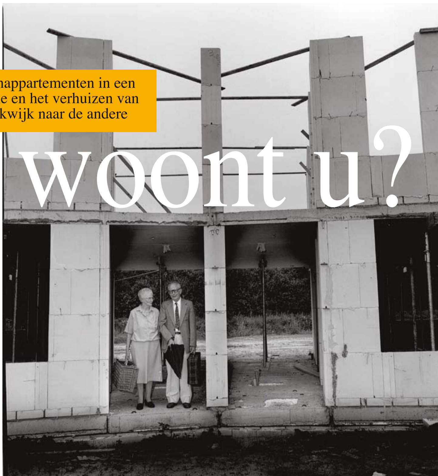
Marcel Malherbe/Hollandse Hoogte

Een nieuwe levensfase stelt nieuwe eisen aan huisvesting. Maar hoe staat het daarmee? Hoeveel oog heeft de samenleving voor de woningvraag van ouderen?