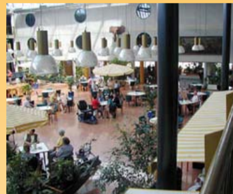
Het restaurant aan het Bergwegcomplex

Het LVGO stelt als minimumleeftijd vijftig jaar, bij Humanitas is dat 55 jaar. Het Bergwegcomplex beschikt over ruimten voor avond- en nachtverpleging en herbergt ook een artspraktijk. Daarnaast is er een supermarkt, restaurant en een bar. De bewoners worden gestimuleerd de dagelijkse dingen zo veel mogelijk zelf te doen, maar