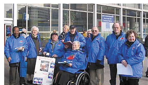
Rotterdamers op het Centraal Station om de roltrappen te controleren

totaalpakket, waarbij klanten tussen de 5,80 en 8,40 euro per kwartaal moeten betalen voor diensten die ze helemaal niet willen. In Nijmegen werd na actie van de SP-ouderen de opheffing van een buslijn teruggedraaid. Amsterdam ijvert voor gratis openbaar vervoer voor ouderen – zoals in België al is ingevoerd. En Rotterdam heeft met acties een regelmatig overleg afgedwongen met vervoerbedrijf RET over de roltrappen en liften van de metro die om de haverklap kapot zijn. Erg populair zijn de uitstapjes die plaatselijke platforms organiseren. Vanuit Eindhoven werd een busreis naar het Europarlement in Brussel georganiseerd. De animo was zo